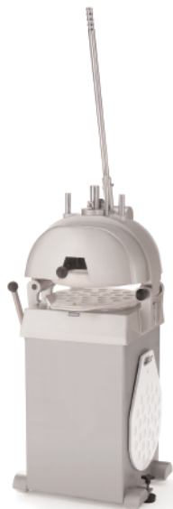
DSF015I - DSF022I DSF030I - DSF036I