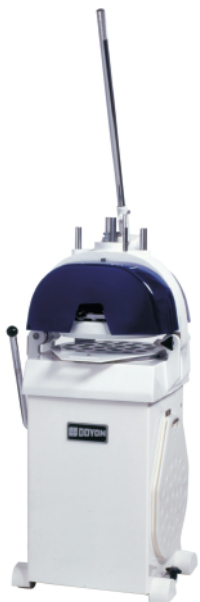
DSF015 - DSF022 DSF030 - DSF036