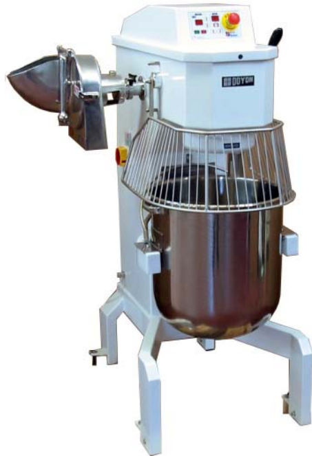
BTFO40H (40 litres)