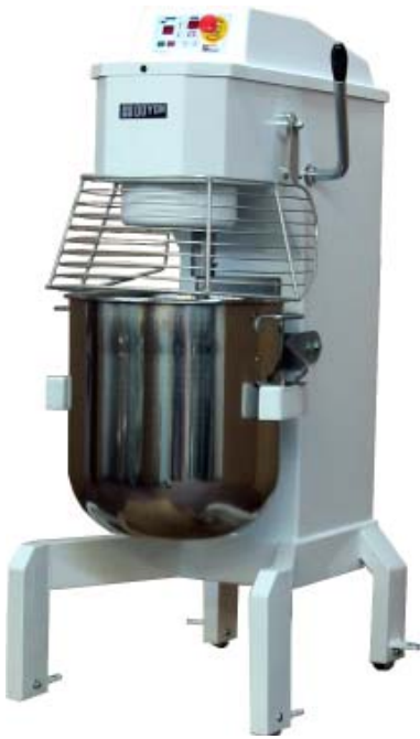
BTFO20 (20 litres)