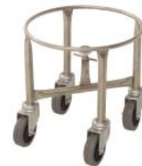
Stainless steel bowl dolly on casters (BTF040D & BTF060D)